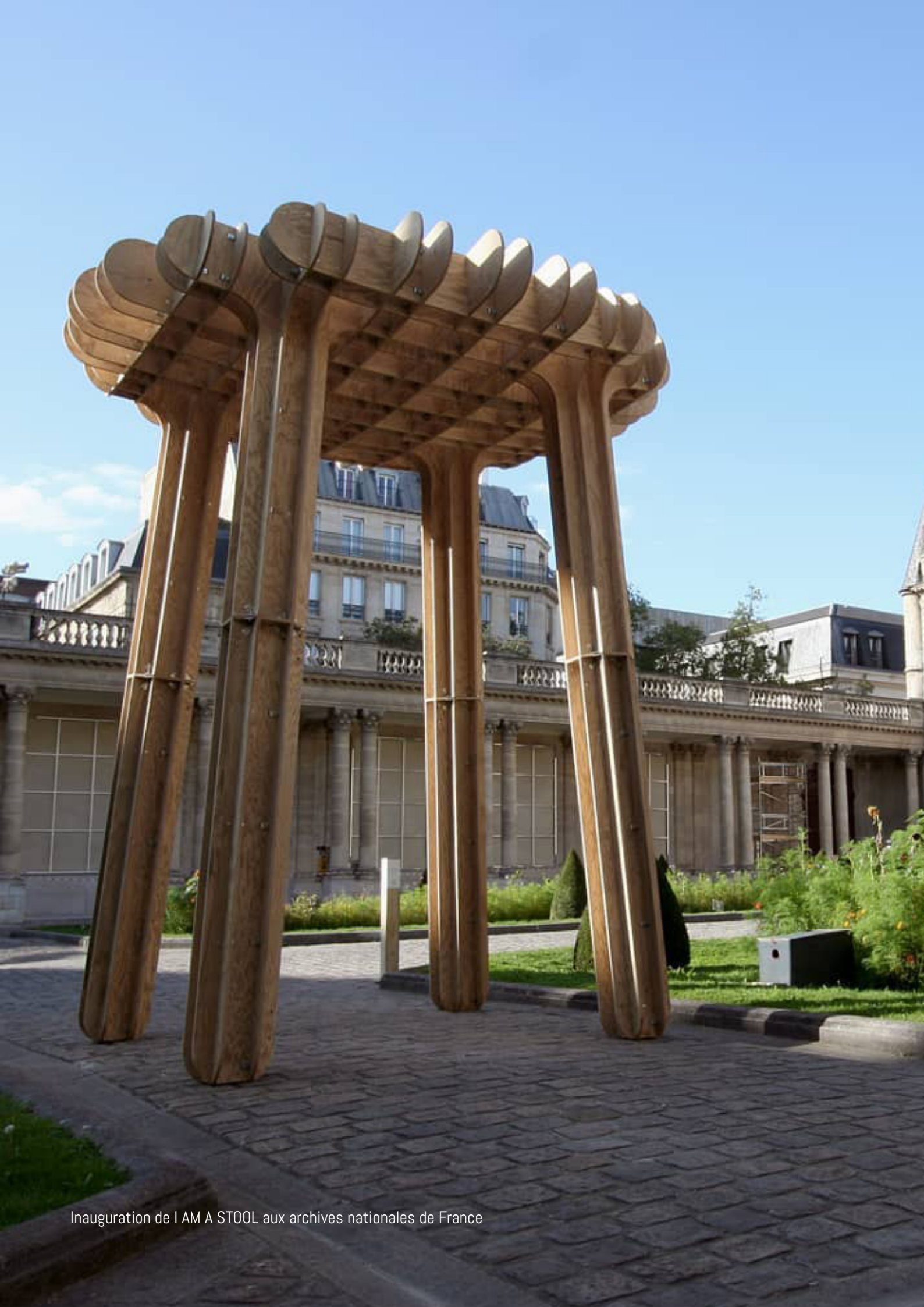
Inauguration de I AM A STOOL aux archives nationales de France