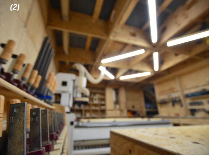
Workspaces – (1) at construction site and (2) temporary location