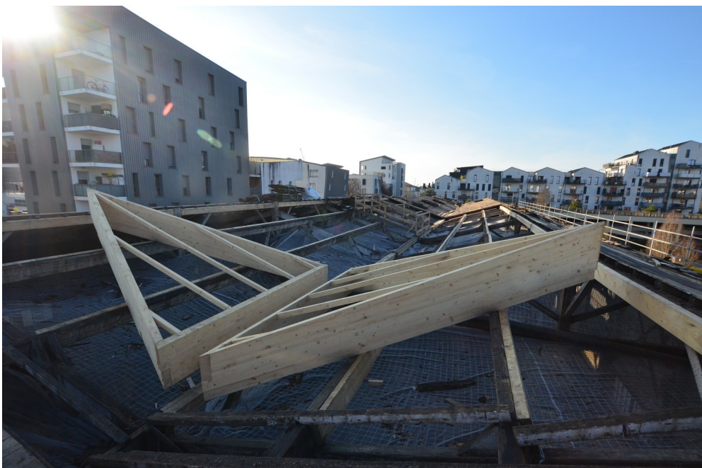
Views of the construction site